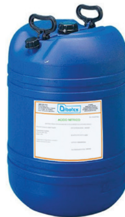
Tan. da 50 kg Cubo 1.000 Kg

Prodotto industriale con proprietà acidificanti, è un correttore di pH e neutralizza i bicarbonati sciolti nell'acqua. Svolge un'azione disincrostante mantenendo pulite le linee di irrigazione quali ai gocciolanti usa e getta e impianti a goccia con gocciolatori intrusi o inseriti. Acido Nitrico 36 Bè viene impiegato in fertirrigazione allo scopo di neutralizzare i bicarbonati disciolti nell'acqua di irrigazione, correggendola e acidificandola. Utile per tutte le colture in presenza di acque anomale da correggere ed indispensabile in quelle coltivate fuori suolo.