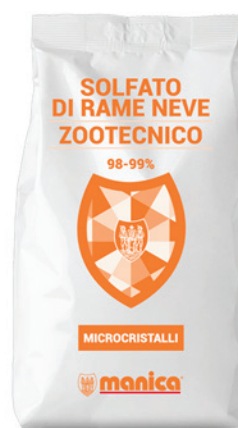
Sacco da 25 kg

Il solfato di rame trova applicazioni come anticrittogamico e reagente analitico.