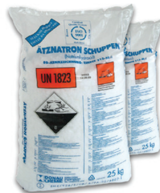
Sacco da 25 kg

L'idrossido di sodio, commercialmente noto come soda caustica, è una base minerale forte, solido a temperatura ambiente, estremamente igroscopico e deliquescente.